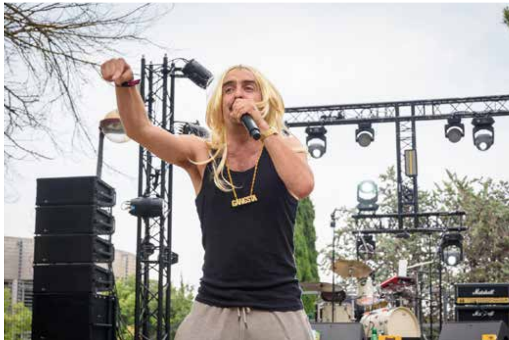
Sorties de résidences de GOLDI à Marseille (Le Non-Lieu), Aix-en-Provence (Festival Zik-Zac) et au Touvet (Festival Place Libre).