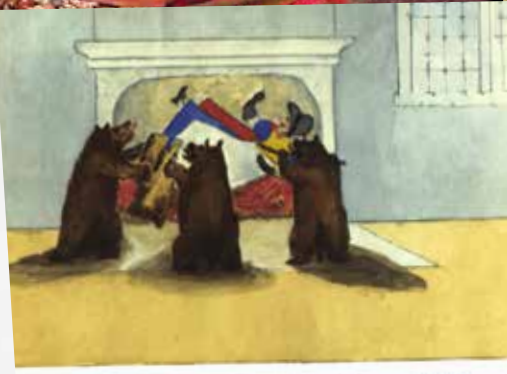
In the fire they throw her, but burn her they couldn't